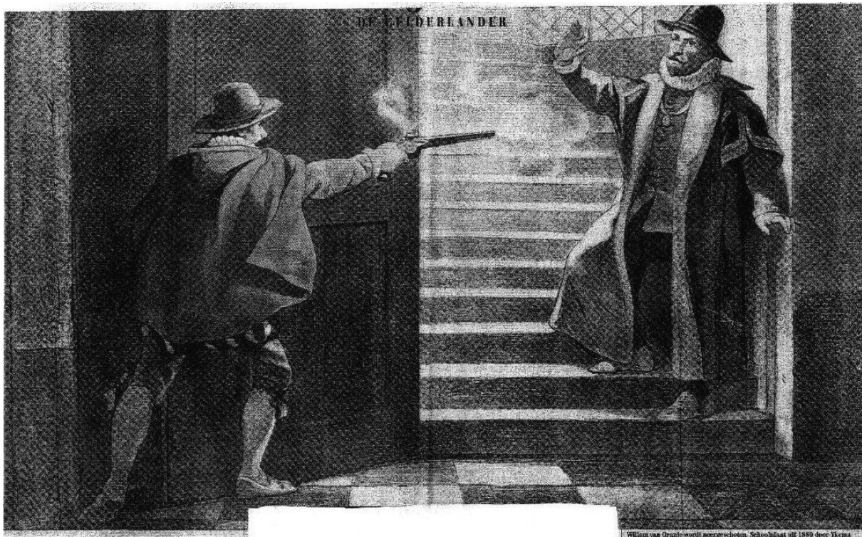
Historische plaat van uitgeverij Joh. Ykema. De aanslag op Willem van Oranje.