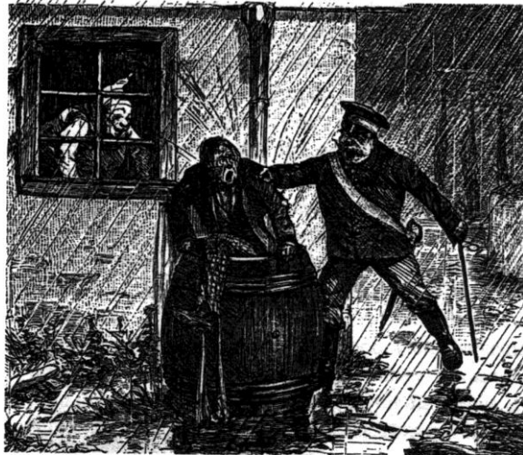
'Boontje komt om zijn loontje' uit: Voor 't jonge Volkje. Een geïllustreerd tijdschrift voor de jeugd. [jrg. 11]. s-Gravenhage, Joh. Jkema, 1885.

Inbreker valt bij een inbraakpoging in de regenton en wordt kletsnat door de 'wijkagent' ingerekend. (uit; 'Voor 't jonge Volkje')