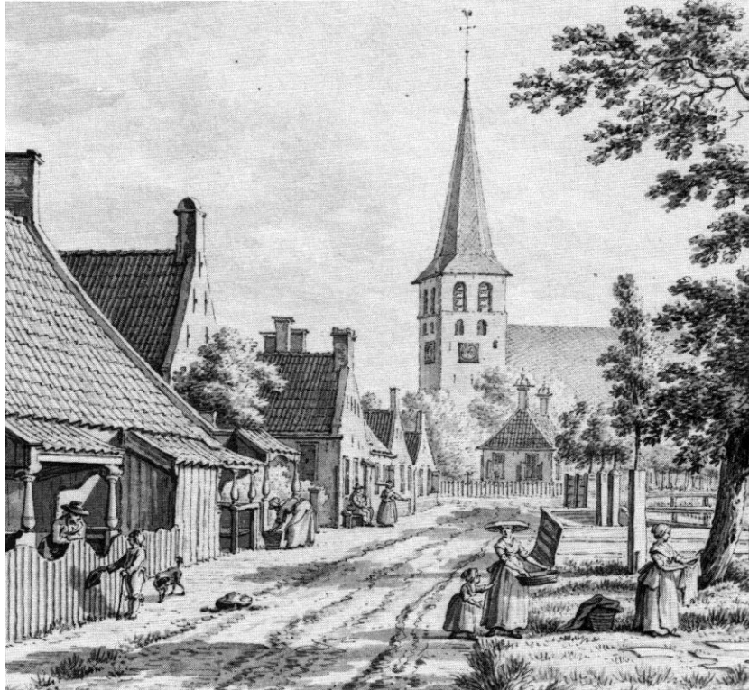
Dorpstafreeltje in Nijland in 1791. Tekening van J. Bulthuis.

Intussen is het leger van Napoleon in de Russische vrieskou volledig vernietigd. Ook jongemannen uit Friesland, gedwongen om Frans soldaat te worden, lieten daarbij het leven. Een Russisch kozakkenleger bereikt zelfs Nederland. Op 16 november 1813 schrijft maire Yke Johannes Ykema aan de sous-prefect Van Welderen Rengers dat vreemde troepen in zijn gemeente zijn waargenomen. De Fransen slaan massaal op de vlucht.