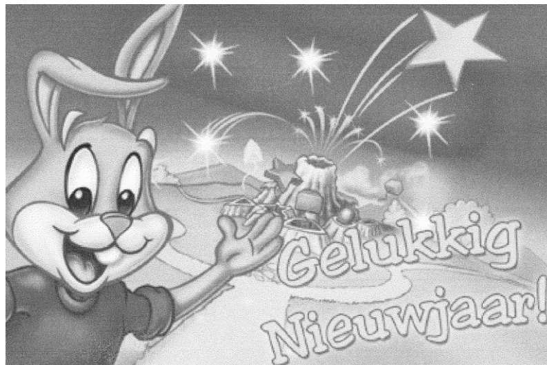
Een Gelukkig 2012