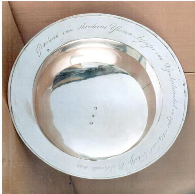
Het Ykema doopbekken.

De blijde gebeurtenissen zullen de grootouders hebben geïnspireerd tot het schenken van het bekken aan de kerk. Het is mogelijk dat Fokeltjes eerste kleinkind, de naar haar vernoemde Fokeltje (17-2-1842) als eerste is gedoopt met het bekken.