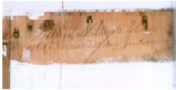
Handschrift van timmermans knecht Willem Meinderts Ykema in het gewelf van de kerk.