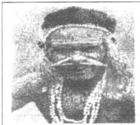
Een papoea van de stam der marindinezen uit de omgeving van Merauke (100 jaar kath. missie).

Omdat de watervoorziening een probleem was, zorgde de assistent resident ervoor dat de paters over een groot watervat konden beschikken..