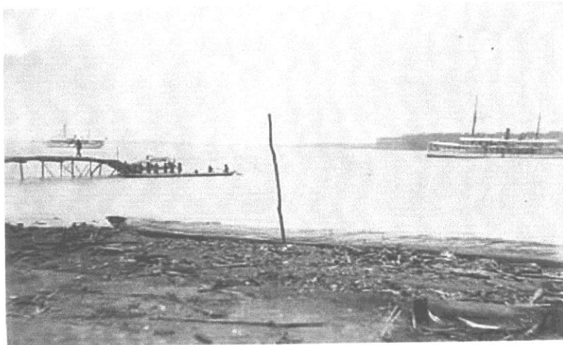
De rede van Merauke in 1900. De schepen op de rede zijn van de Gouvernementsmarine. (Uit 100 jaar kath. kerk Merauke)

Het moet een heel aparte, maar ook angstige ervaring zijn geweest; te leven met burens die buiten de grenzen van de kleine nederzetting nog op bloederige wijze in het Stenen Tijdperk verkeerden. Niet ergens ver van de kust vandaan, verscholen in het onherbergzame tropische regenwoud, maar op 5 km afstand in het dichtstbijzijnde Papoea dorpje!